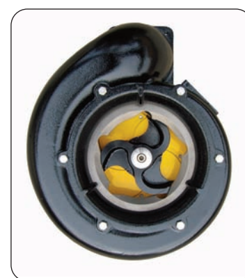
Girante con coltelli Shearing impeller

Possibility to install on the discharge mouth the SG4 a slurry gate fluid mixer. See page X