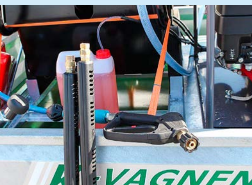
K-heat kan fås med skruvbara kopplingar till redskapen isället för snabbkopplingar. Valfritt enligt vad kunden önskar.