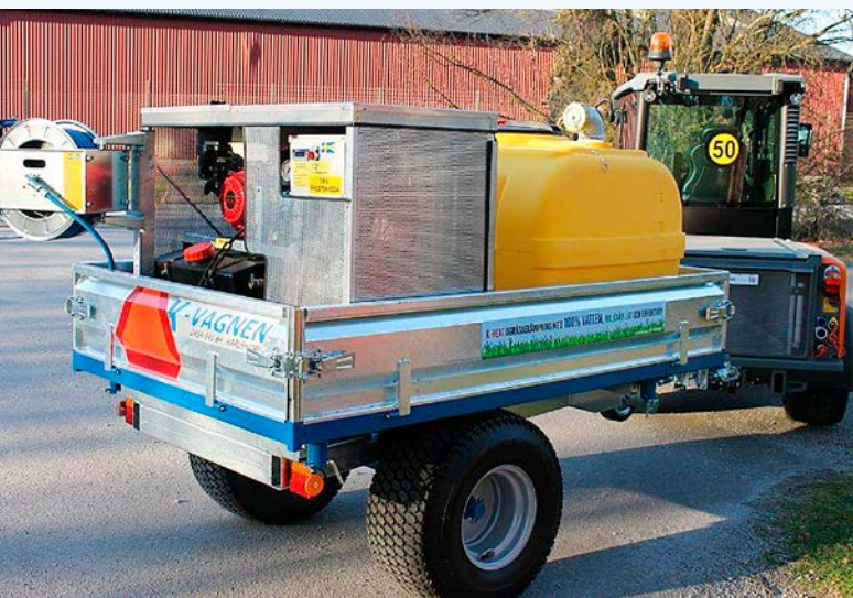
K-heat Compact med 600 liters vattentank monterad på K-vagnen 1600 T3 flakmått 2000x1250 mm.

K-heat Compact har framtiden för sig – inte minst tack vare drivkällan från Honda Power och proffsslangvinda med 20 m mjuk böjlig slang som tål 150° C och 340 bar. Pistol med snabbkoppling av redskap, lätt och smidigt. Finns även med skruvkopplingar för anpassning till annat system. Elstart som standard.