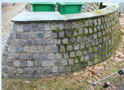
Turbomunstycke/rotorstråle ger dubbel tvätteffekt.