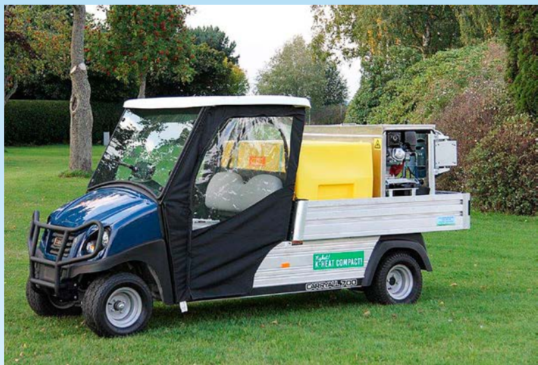
Smidiga K-heat Compact passar bra på elbilsflak m.m.