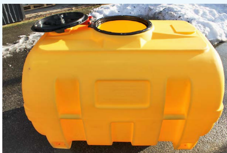
Plasttank 1000 l. Längd 1450 mm, höjd 1140 mm, bredd 1000 mm. Vikt 54 kg. Mannlucka 380 mm. Levereras med anslutningar.