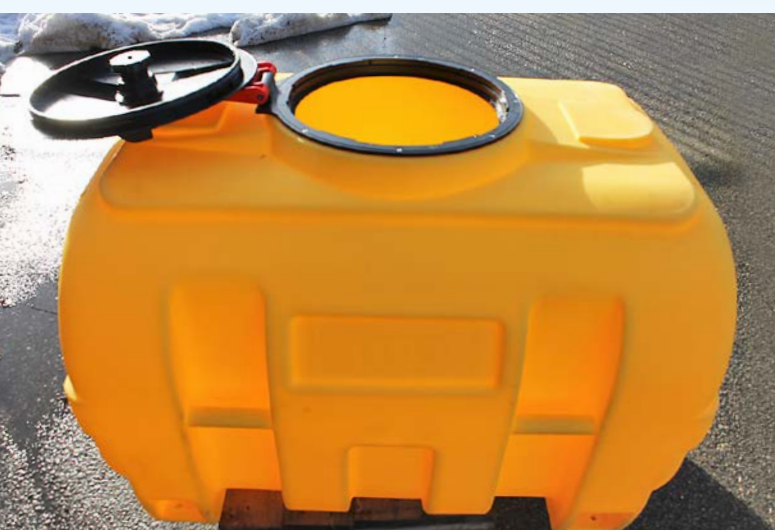
Plasttank 600 l. Längd 1100 mm, höjd 900 mm, bredd 900 mm. Vikt 35 kg. Mannlucka 380 mm. Levereras med anslutningar.