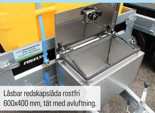
Låsbar redskapslåda rostfri 600x400 mm, tät med avluftning.