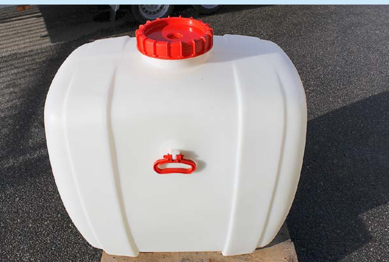
Plasttank 300 l. Längd 910 mm, höjd 890 mm, bredd 590 mm. Vikt 13,5 kg. Levereras med anslutningar.