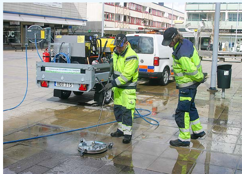
Med den här tillbehöret befrias snabbt stora ytor från alger, smuts, mossa, tuggummi och annat skräp som bitit sig fast i beläggningen.