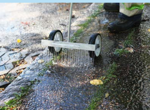
Ogräsmunstycke med höga hjul finns som tillval.