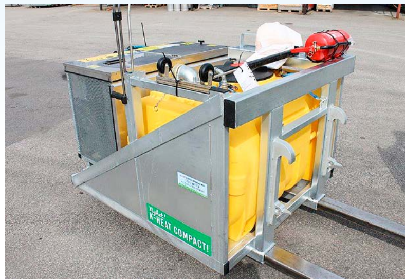
K-heat Compact med plattform för lastmaskin har gaffeltunlar som standard.