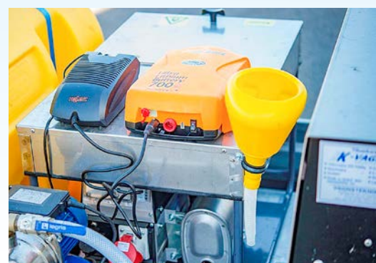
K-heat Maxi och Compact har som standard generator 230 V som kan användas till mer än att ge ångpannan ström. T.ex. ute på en kyrkogård eller bostadsbolag för att ge batteriladdare ström till grästrimmer, häcksax m.m. Det blir ju allt vanligare med batteridrivna maskiner ute på fältet !