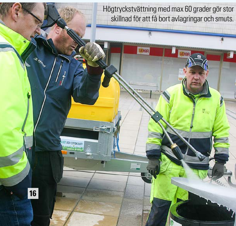
Högtryckstvättning med max 60 grader gör stor skillnad för att få bort avlagringar och smuts.