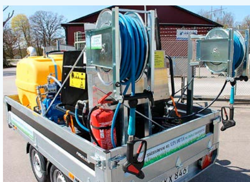
Extra slangvinda för ogräsbekämpning. Fördel för de som har mycket plattytor och smala ytor längs väggar m.m. Vid dessa ytor räcker det med reducerad arbetsbredd. Detta möjliggör att två personer kan arbeta parallellt med reducerad mängd hetvatten 4,5 l/min. Lämpligt munstycke är spaltmunstycke samt den utan hjul.