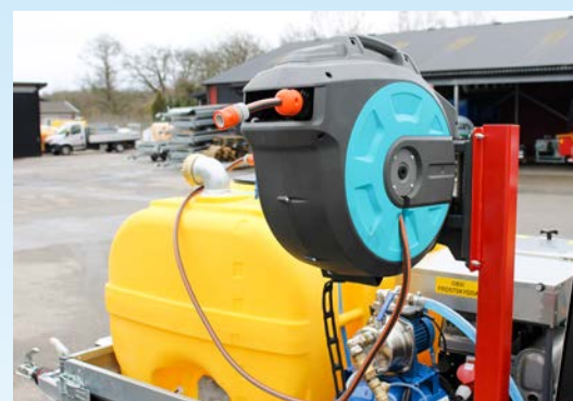
Gardena 35 meters fast slangvinda för tankning från vattenutkastare på till exempel bostadsrättsföreningar eller kyrkogårdar m.m.