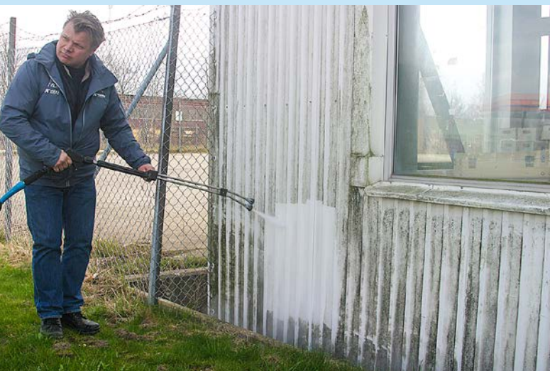
K-heat är även perfekt till kraftigt nersmutsade hus och väggar m.m.

Ibland är det enkla det mest geniala! Nu är det 98-gradigt hetvatten som gäller istället för att belasta miljön med bekämpningsmedel!