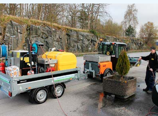
K-heat Maxi har en smart lösning! Vattenpumpen som matar vattnet till ångpannan kan på ett enkelt sätt byggas om med ett T-rör och en kran samt en slangvinda så har man en kanonbra bevattningsvagn! Obs! Detta gäller inte Compact eftersom den inte har tryckmatning.