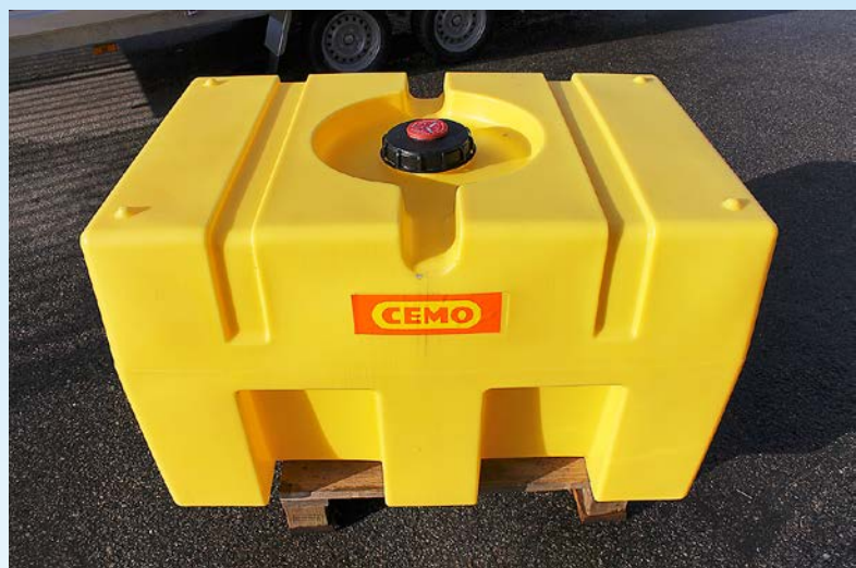
Plasttank 450 l. Längd 1116 mm, höjd 730 mm, bredd 760 mm. Vikt 13,5 kg. Levereras med anslutningar.